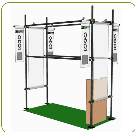
STAND PREARMADO de 8 mq (4x2)